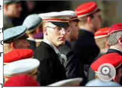
Burschschafter (in Eisenach): Image als Säbelrassler