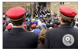
Burschenschaftstag (in Eisenach): Kein Zutritt für Frauen und Ausländer

Im großen Saal hängen, leicht verstaubt, die alten Herren. Entlang der getäfelten Wände schauen sie auf lange Tische, Stühle mit eingeschnitztem Emblem und die schwarz-weiß-rote Fahne über dem Rednerpult. Die Bilder in Holzrahmen gehören zum Inventar der Kölner Burschenschaft Germania. Jochen T. trainiert seit Monaten, damit auch er einen Platz in der Fotoreihe erhält - für ewig.